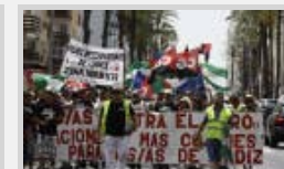
La marcha por el empleo recorre la provincia