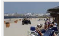
Izado las banderas azules en Cádiz