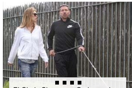
El Cholo Simeone y Carla pereira, dos auténticos tortolitos que no esconden su amor