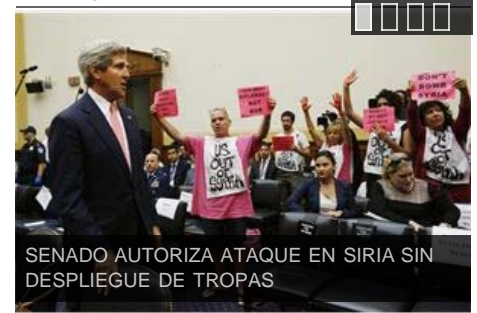
SENADO AUTORIZA ATAQUE EN SIRIA SIN DESPLIEGUE DE TROPAS